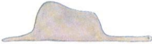
Rysunek 2. słoń

Lorem ipsum dolor sit amet, consectetur adipiscing elit. Nunc sed maximus mauris, eget mollis risus. Ut non accumsan augue. Fusce at lectus elementum, lobortis velit sit amet, pretium nibh. Proin suscipit suscipit mi, eget tristique libero mollis feugiat. Pellentesque condimentum pharetra vulputate. Ut fringilla velit nisi, ac mollis nisi tincidunt a. Curabitur egestas nibh eget porttitor aliquet.