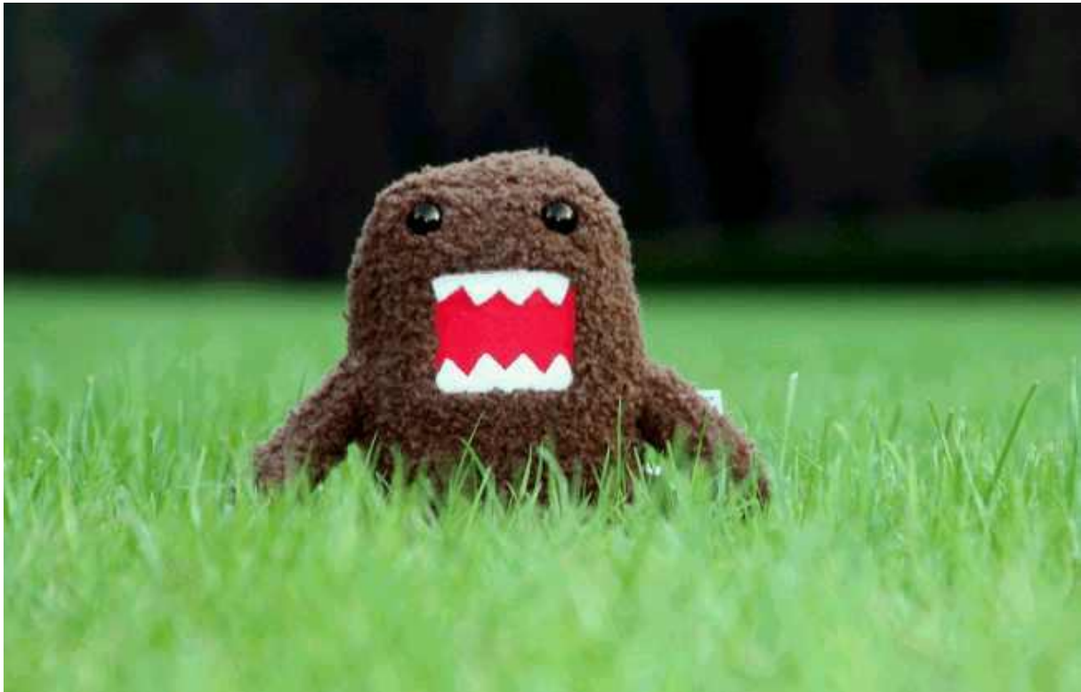
Rys. 3. buzie

lamcorper erat dapibus sed. Cras finibus porta ante, non viverra est. Nullam suscipit varius ligula. Etiam tempus convallis sem, ut conseq